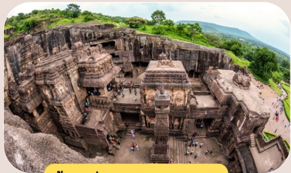
ถ้ำเอลโลรา (Ellora Cave)

ถ้ำอชันตาประกอบด้วยขุมถ้ำจำนวน 30 ถ้ำ ถูกสร้างจากคติความเชื่อทางพระพุทธศาสนาทั้งฝ่ายเถรวาทและมหายาน บอกเล่าเรื่องราวเกี่ยวกับพุทธประวัติ ส่วนถ้ำเอลโลราจะมีความแตกต่างจากถ้ำอชันตา โดยภายในประกอบด้วยวิหารทางศาสนาพุทธ ฮินดู และเชน ปัจจุบันมีทั้งหมด 34 ถ้ำ ที่มีเรื่องราวเกี่ยวกับศาสนสัมพันธ์ความหลากหลายของศาสนา วิวัฒนาการการเผยแผ่พระพุทธศาสนาในยุครุ่งเรือง ถดถอย ฟื้นฟู และรุ่งโรยในแถบอินเดียตะวันตก จึงถือเป็นสถานที่ท่องเที่ยวทางศาสนาที่ควรค่าแก่การไปศึกษาและเยี่ยมชมครั้งหนึ่งในชีวิต !!!!