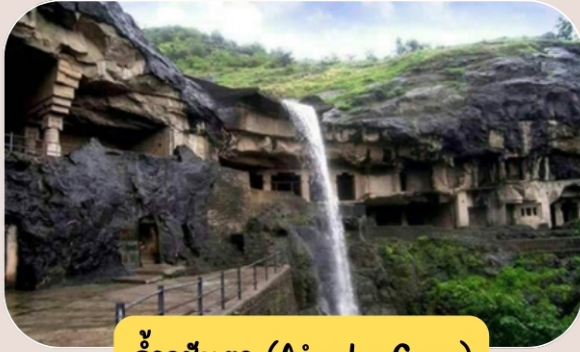
ถ้ำอชันตา (Ajanta Cave)