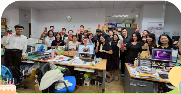
เลี้ยงวันครบรอบวันเกิดของบุคลากรในสำนักเดือนเมษายน วันที่ 30 เม.ย. 69