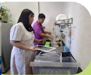
กิจกรรม 5ส ภายในสำนักงาน วันที่ 2 เม.ย. 69