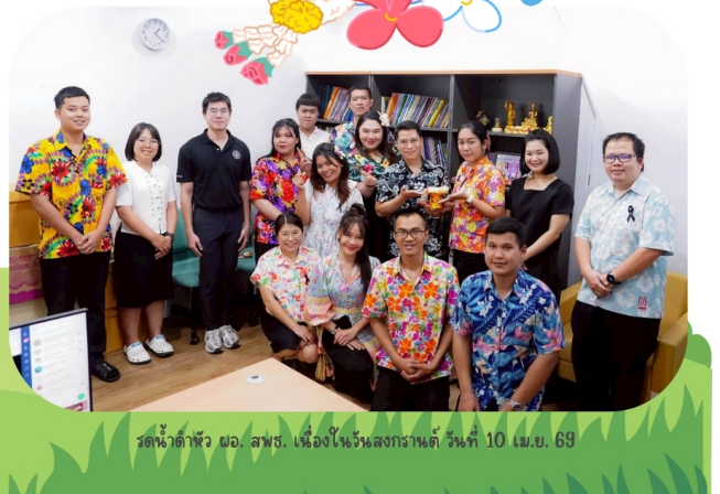
รดน้ำดำหัว ผอ. สพฐ. เนื่องในวันสงกรานต์ วันที่ 10 เม.ย. 69