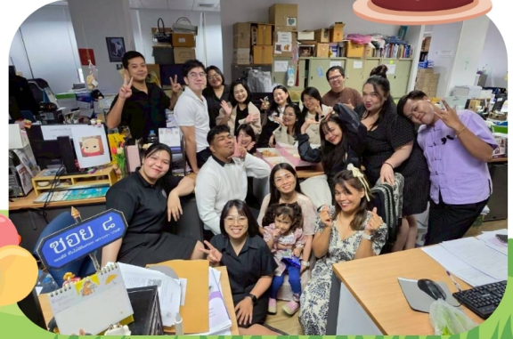
เลี้ยงวันครบรอบวันเกิดของบุคลากรในสำนักเดือนพฤษภาคม วันที่ 1 พ.ค. 69