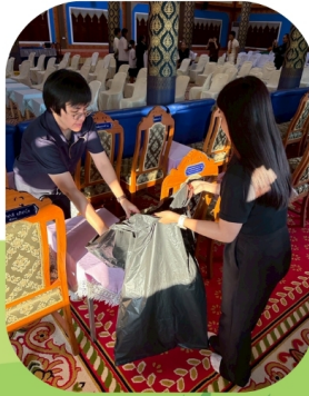
ทำความสะอาดสถานที่กิจกรรม ประทศบรยายธรรม วันที่ 31 มี.ค. 69