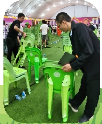
ทำความสะอาดสถานที่หลังเสร็จสิ้นกิจกรรมสวดมนต์หมู่ วันที่ 10 พ.ค. 69