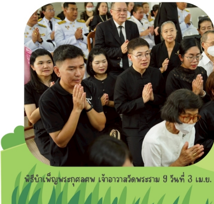
พิธีบำเพ็ญพระกุศลศพ เจ้าอาวาสวัดพระราม 9 วันที่ 3 เม.ย. 69