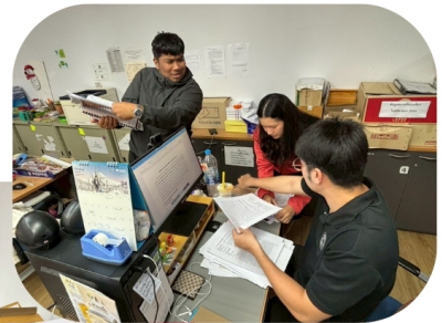
กิจกรรม 5ส ภายในสำนักงาน วันที่ 15 พ.ค. 69