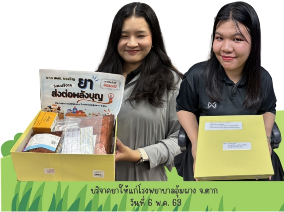
บริจาคยาให้แก่โรงพยาบาลอ้อมแฝง จ.ตาก วันที่ 6 พ.ค. 69